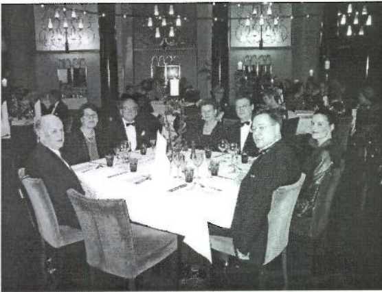
Pörssiravintolan pöydässä viihtymässä vanhoja ja vähän nuorempia veljiä puolisoineen.